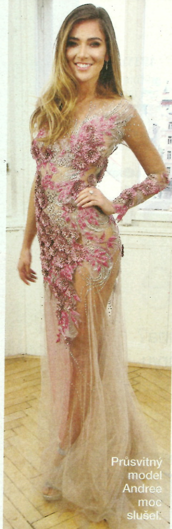
Průsvitný model Andree moc slušet.