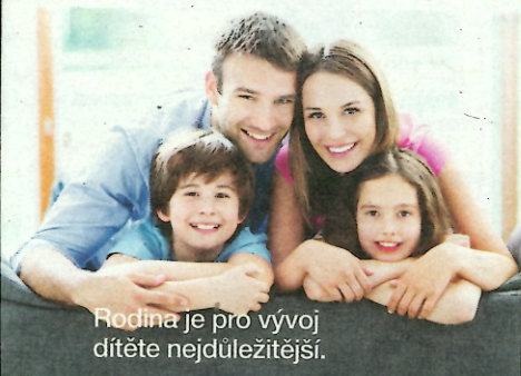
Rodina je pro vývoj dítěte nejdůležitější.

Věděla jste, že rozvodem v Česku končí téměř polovina manželství? Podle statistik je konkrétní číslo 47,8 %. I na to, že manželství vydrží v České republice v průměru 13 let, reaguje kampaň organizace Síť pro rodinu, která upozorňuje na důležitost rodiny pro každého jedince i pro celou společnost, a to navzdory tomu, jak se současná rodina proměňuje a rozpadá. U příležitosti 25. výročí otevření prvního mateřského centra v České republice a 15. výročí založení Sítě pro rodinu odstartovala v lednu kampaň, která bude od května pokračovat projektem Rodina v centru pozornosti a na podzim vyvrcholí setkáním odborníků. Bližší program najdete na internetových stránkách www.sitprorodinu.cz .